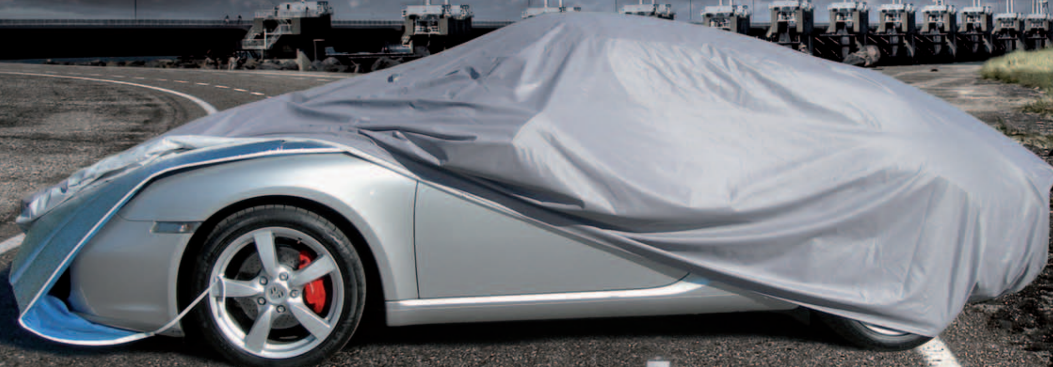
DIMENSIONI VETTURE IN METRI car dimensions in meters